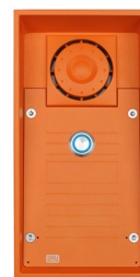
2N® Helios IP Safety